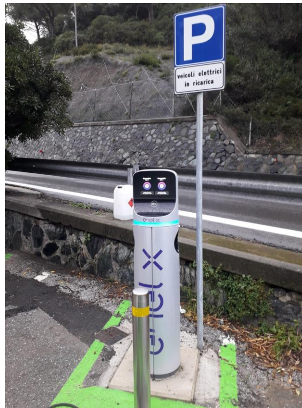
Colonnina di Piazza Negrin