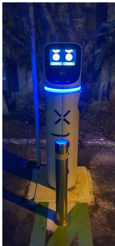
Colonnina di Piazza San Michele