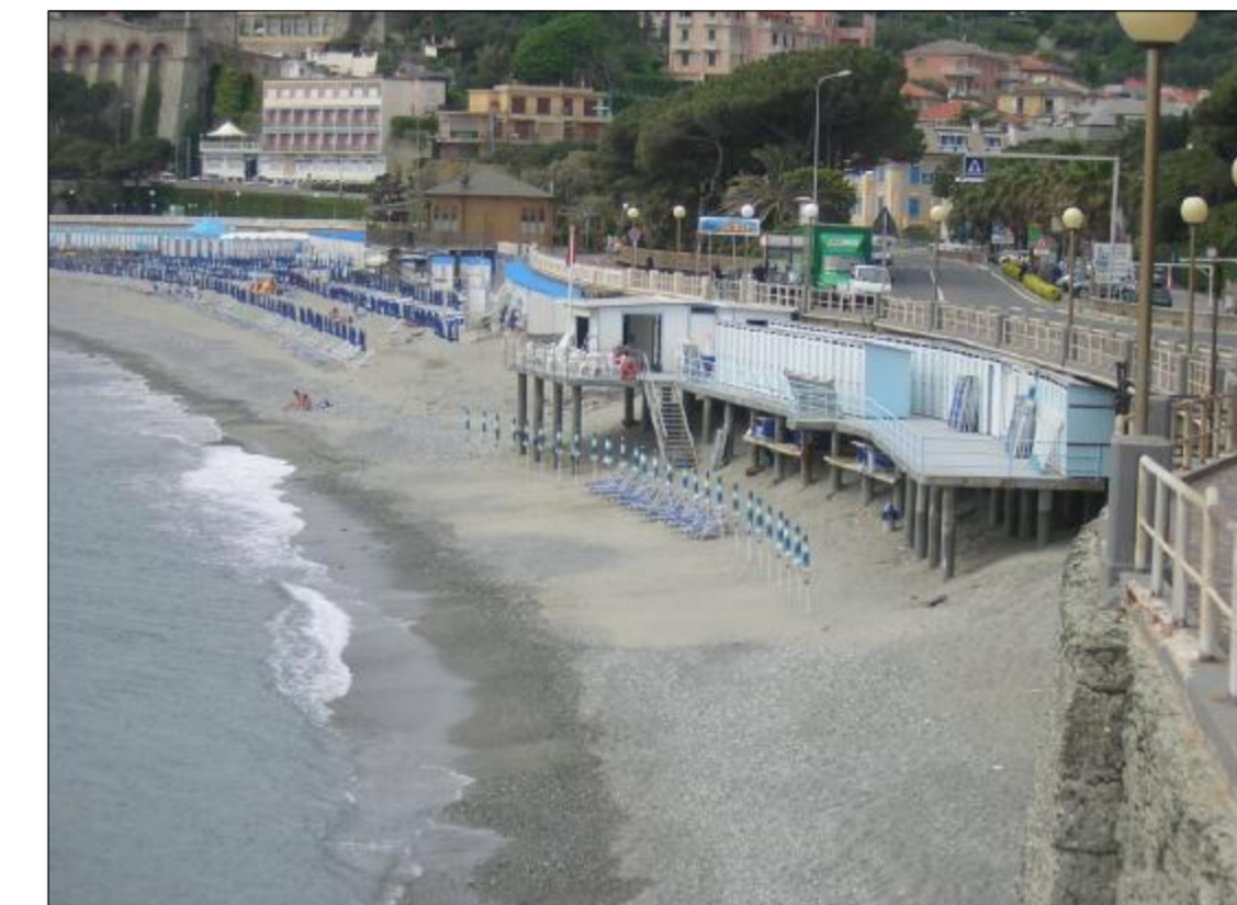
Foto 2 - Vista della concessione Bagni Sole da est: una parte della piattaforma in cemento armato (dove sono presenti le cabine), nella configurazione di progetto, ricadrà nella spiaggia comunale.