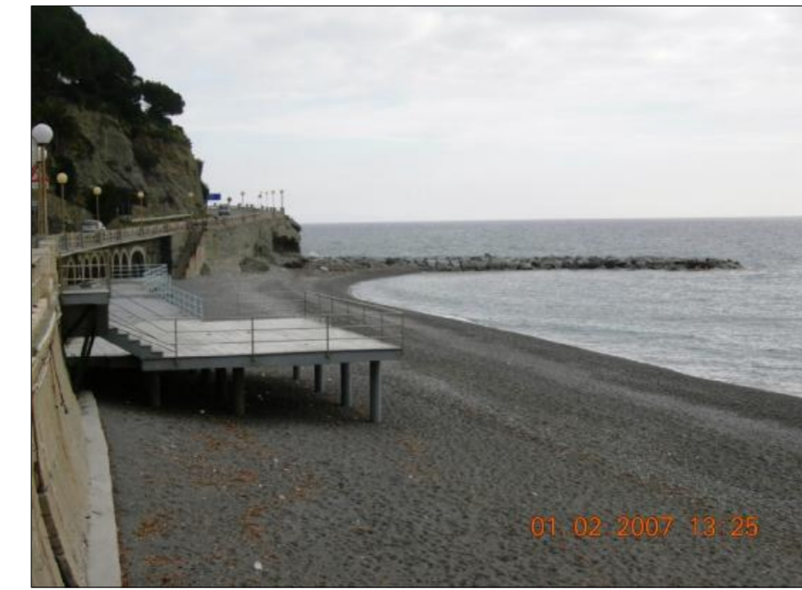
Foto 1 - Vista del limite est della spiaggia dei Piani, in una configurazione invernale: è visibile la piattaforma in cemento armato su pali, oggi interamente nella concessione dei Bagni Sole.