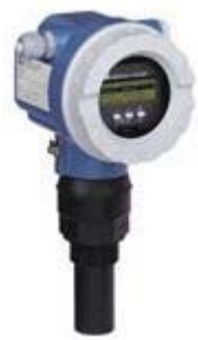
Sensore ad ultrasuoni

L'impianto di controllo del livello di piena del torrente Ghiare è costituito da un sensore ad ultrasuoni in grado di misurare, in continuo, la distanza dal piano dell'acqua sottostante.