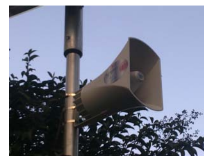
Sirena Via Colla

vengono inviati gli SMS ed attivate le sirene d'allarme in Via Colla (zona scuole elementari di Baodo) e in Via Boagno (angolo palazzo comunale) in modo da avvisare direttamente la popolazione.