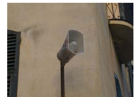
Sirena Via Boagno