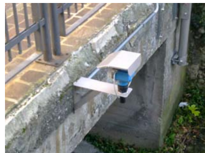
Sensore Via Colla

Lo strumento ad ultrasuoni fornisce in uscita un segnale elettrico in corrente proporzionale alla distanza misurata, variabile da 4 a 20 mA. Il segnale viene elaborato da un convertitore analogico/digitale che attiva a sua volta le segnalazioni e gli allarmi verso l'esterno mediante modem su rete telefonica GSM.