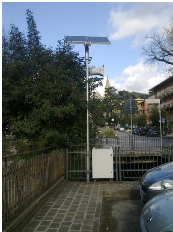
Impianto di Via Colla